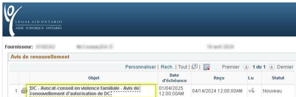
Figure 3 : Capture d'écran de l'avis de renouvellement de l'autorisation comme indiqué ci-dessus.

Vous serez alors invité(e) à consulter tous les avis de renouvellement d'autorisation, ainsi que leurs dates d'échéance, comme le montre la figure 3.