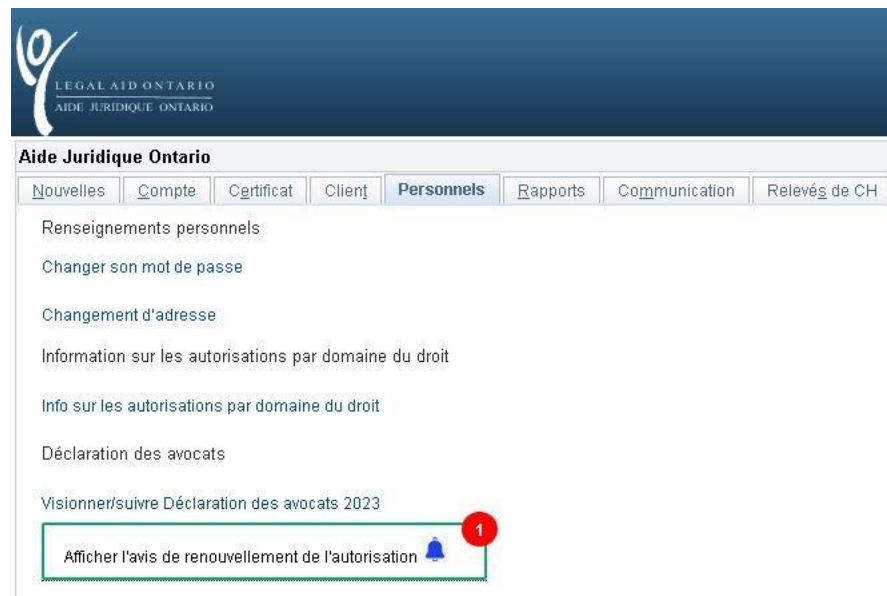
Figure 2 : Capture d'écran de la navigation dans Aide juridique en ligne mettant en évidence un avis pour les avis de renouvellement.